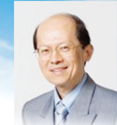
新加坡陈英俊医生 供稿